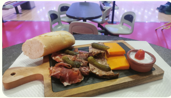
Planche apéritive mixte ..... 10,50€ (charcuterie/fromage)